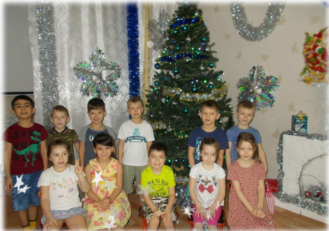
«В гостях у елочки»