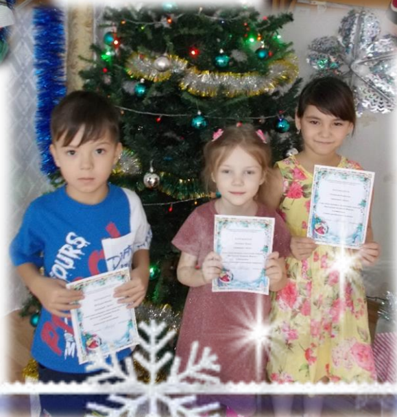
«Участие в конкурсе новогодней игрушки»