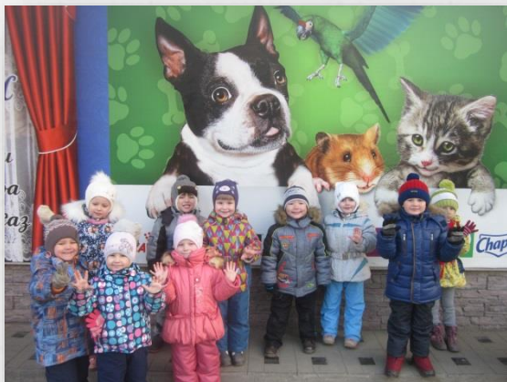
Дома моего города