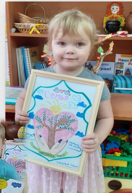
Герб моей семьи